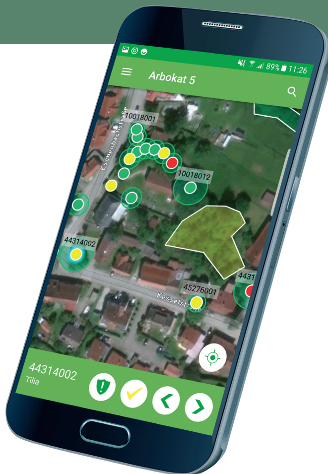
Arbokatk® App: Baumkontrolle schnell und unkompliziert

Als Kartengrundlage nutzt die Arbokat® App hochwertige Hintergrundkarten aus ArcGIS Online (Luftbilder und Straßendaten). Die Bereitstellung von Geodaten für den Außendienst ist nicht notwendig.